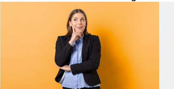
Kaufmännisch und IT