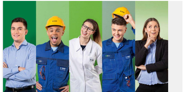
Weitere spannende Möglichkeiten