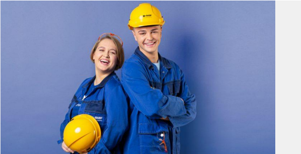
Elektro- und Metalltechnik

Du suchst eine Ausbildung, bei der du deine Stärken einbringen kannst? Wir suchen Menschen wie dich, die mehr aus ihren Fähigkeiten machen wollen. Wir sind das führende Chemieunternehmen der Welt und bieten dir über 50 mögliche Ausbildungschancen.