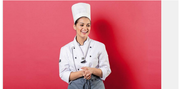
Gastronomie & Hotel